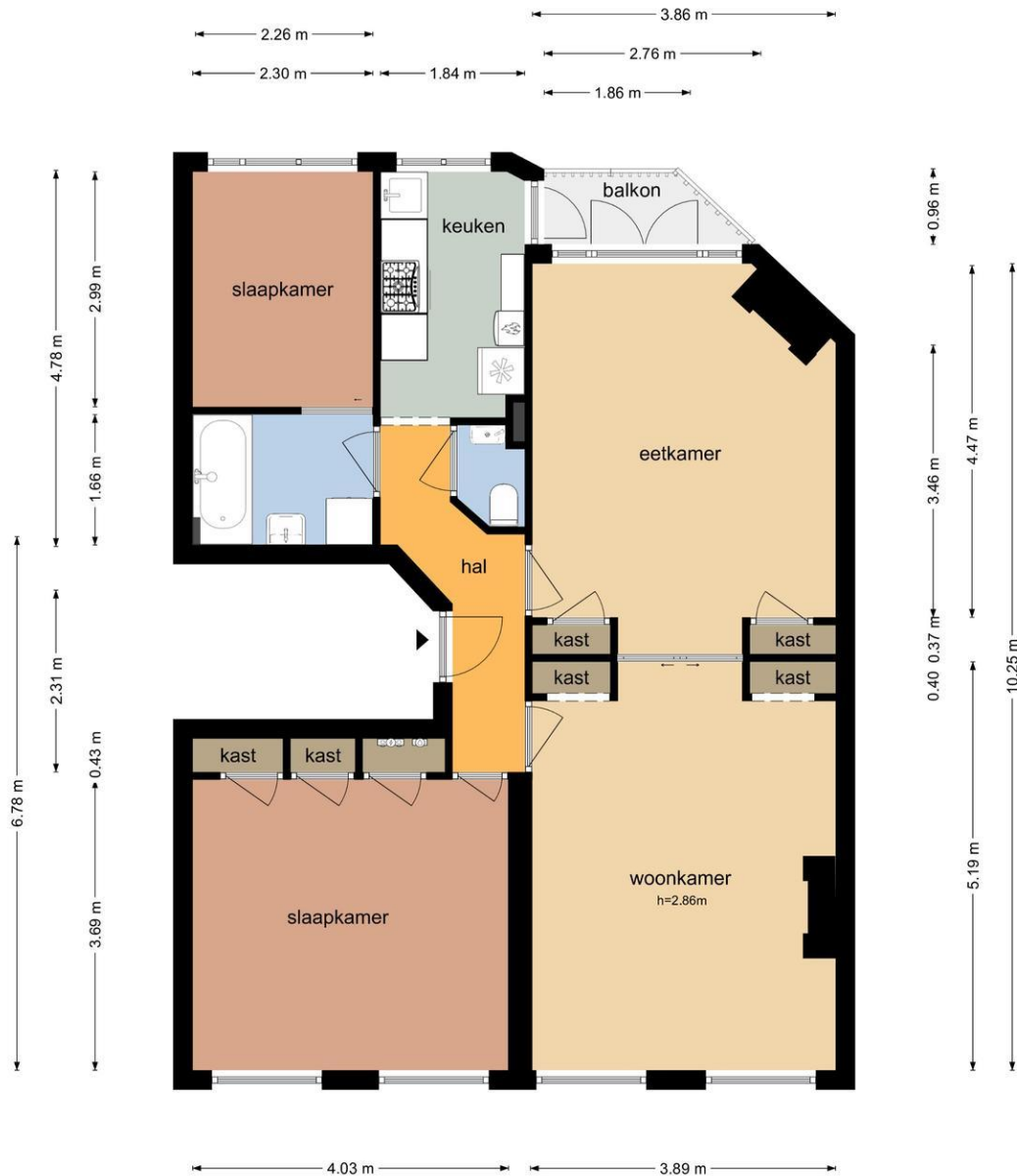
Slaakstraat 4 I - Amsterdam Eerste Verdieping

De plattegronden zijn geproduceerd voor promotionele doeleinden en ter indicatie. Aan de plattegronden kunnen geen rechten worden ontleend © www.objectenco.nl