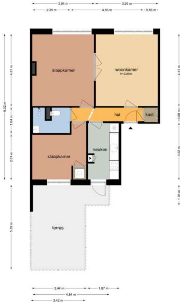
Carillonstraat 12-1 - Amsterdam Appartement

De plattegronden zijn geproduceerd voor promotionele doeleinden en ter indicatie. Aan de plattegronden kunnen geen rechten worden ontleend. © www.objecten.nl