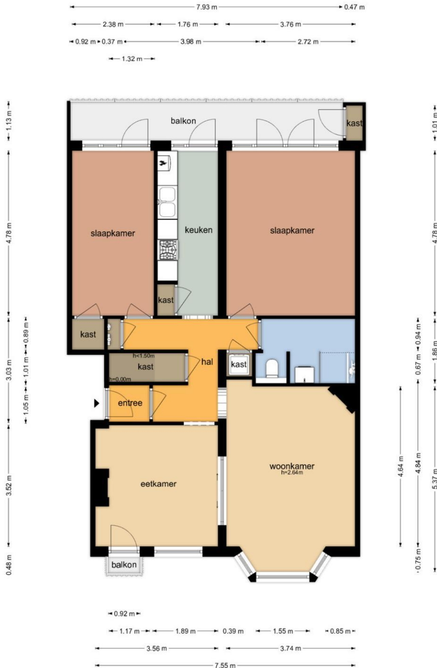
Trompenburgstraat 137 I - Amsterdam Eerste Verdieping

De plattegronden zijn geproduceerd voor promotionele doeleinden en ter indicatie. Aan de plattegronden kunnen geen rechten worden ontleend. © www.objectenco.nl